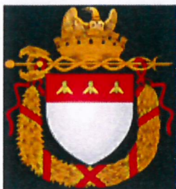
A fianco, lo stemma napoleonico delle bonnes villes

L'emblema adottato dal nuovo Comune di Rio Marina (un'aquila con il petto attraversato da una fascia con tre api, in realtà simbolo ad esclusivo uso del sovrano) si riferisce probabilmente al breve periodo di autonomia riconosciuta da Napoleone, il quale concesse all'Elba la bandiera elbana, a fondo bianco tagliata diagonalmente da una fascia rossa con tre api d'oro . Secondo i miei recenti studi, Napoleone scelse per l'Elba questa iconografia, la stessa delle bonnes villes ovvero di quelle città a lui particolarmente devote, per sottolineare la raggiunta unità territoriale e governativa dell'isola. A buon ragione, alcuni comuni elbani hanno mantenuto la fascia con le tre api sul proprio stemma (vedi Marciana Marina e Campo nell'Elba).