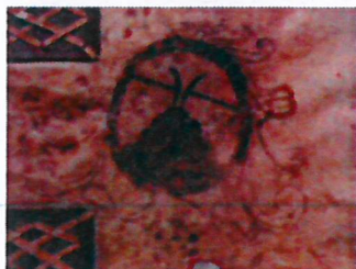
Raffigurazione dell'antico stemma di Rio sopra un documento dell'archivio storico.

Il paese di Rio (che nel suo stemma rappresenta l'importanza del lavoro minerario attraverso l'iconografia di due picconi speculari che sovrastano una montagnola centrale ) sia per l'importanza economica rappresentata dalle miniere di ferro sia per la sua vicinanza al continente, costituì per diversi secoli il capoluogo del territorio elbano dei Principi di Piombino, tanto che fu la residenza di un Governatore con funzioni di "Consultore dei Governatori dell'isola d'Elba".