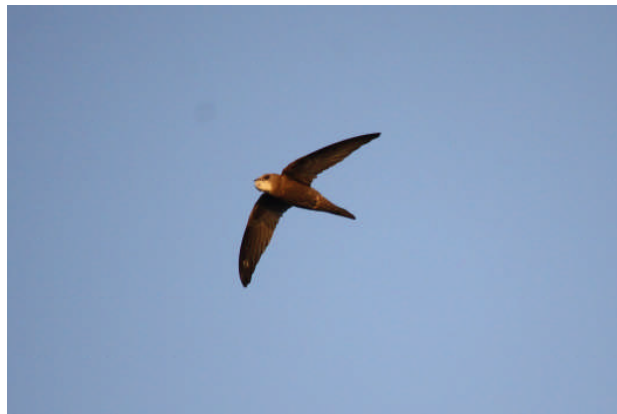
Rondone pallido.

Dal 2015 nella Fortezza Vecchia è attivo un progetto in collaborazione tra Autorità Portuale di Livorno e Lipu sulla gestione ecologica della popolazione nidificante di Gabbiano reale, che ha lo scopo di ottenere un adeguato rapporto di convivenza tra i gabbiani con i turisti ed i visitatori del complesso monumentale.