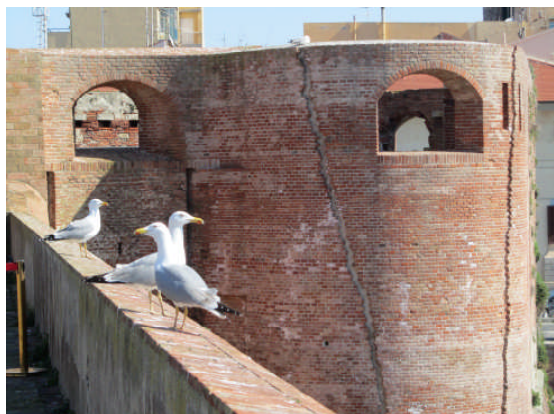
Gabbiano reale.

Nella Fortezza Vecchia di Livorno e immediati dintorni sono state finora osservate 14 specie di uccelli, di cui 6 nidificano negli anfratti del Mastio e dei bastioni, incluso il Gheppio, il Gabbiano reale, il Rondone pallido ed il Pigliamosche.