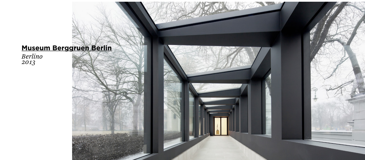
Museum Berggruen Berlin