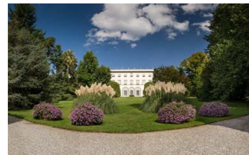
Villa Grabau a San Pancrazio, viale di accesso e facciata