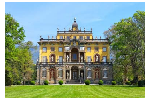
Villa Torrigiani a Camigliano, facciata della villa

Tutti i costi per gli spostamenti/pernottamenti/pranzi e/o cene sono a carico del partecipante salvo dove indicato diversamente.