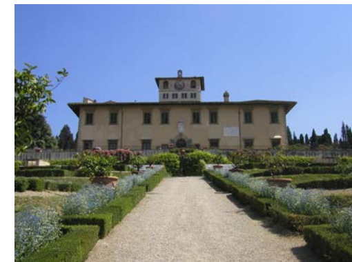
Villa Petraia, vista del parterre e della facciata

Il luogo di ritrovo e la partenza del tour sarà alle ore 10.30 presso l'ingresso della Villa in via della Petraia, 40 a Firenze. Per partecipare al Tour inviare una mail a: segreteria.centrale@aiapp.net entro le ore 13.00 di martedì 19 aprile 2016. Il costo per partecipare è di 10 euro (prezzo del biglietto/ingresso a Boboli) e il tour si attiverà per un minimo di 15 partecipanti e max di 25. Tutti i costi per gli spostamenti/ pernottamenti/pranzi e/o cene sono a carico del partecipante salvo, dove diversamente indicato.