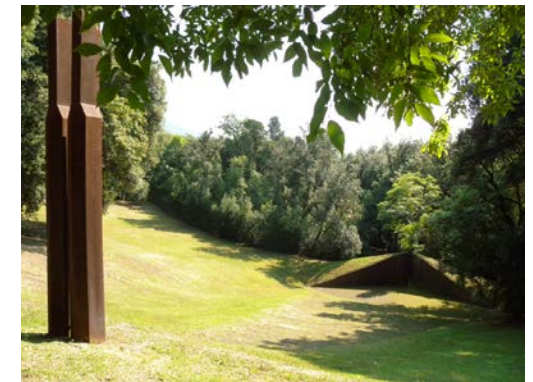
Spazio teatro Celle: omaggio a Pietro Porcinai, 1992. Opera di Beverly Pepper in ghisa, tufo e terra.