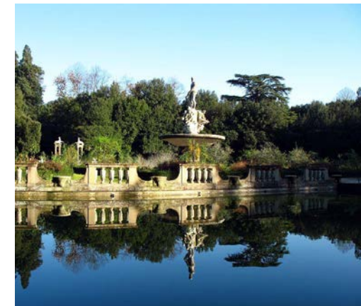
Giardino di Boboli, la Vasca dell'isola