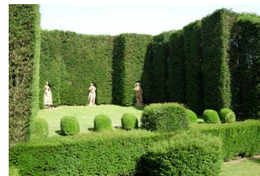
Villa Reale a Marlia, il tetro di verzura